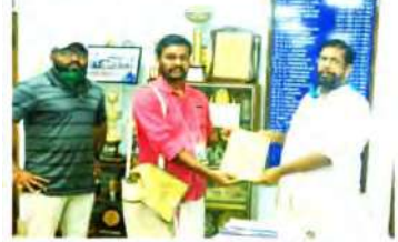
സന്നദ്ധ പ്രവർത്തകരുടെ ലിസ്റ്റ് യൂത്ത് ഡിഫൻസ് കീഴിൽ ഇരുപതു പ്രതിരോധ പ്രവർത്തനങ്ങൾക്ക് ഇപ്പോൾ പങ്കെടുത്തു.

തിരുവനന്തപുരം നഗരസഭയിൽ സേവനസന്നദ്ധരായി നഗരസഭയ്ക്ക് കീഴിൽ യൂത്ത് ഡിഫൻസ് ഫോഴ്സ്. കെ.എം.എസ്. നഗരസഭയിൽ ഇരുപതു പ്രതിരോധ പ്രവർത്തനങ്ങൾക്ക് സംസ്ഥാന യൂത്ത് ഡിഫൻസ് കീഴിൽ 410 മരങ്ങളിലാണ് ഇപ്പോൾ യൂത്ത് ഡിഫൻസ് കീഴിൽ സന്നദ്ധ പ്രവർത്തകർക്ക് ഇപ്പോൾ പങ്കെടുത്തു.