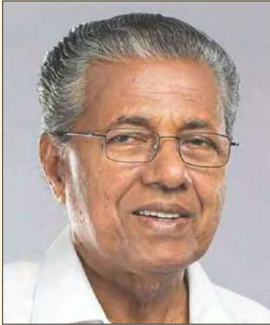
ശ്രീ. പിണറായി വിജയൻ ബഹു. മുഖ്യമന്ത്രി