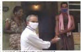
യുവജന കമ്മീഷൻ നേതൃത്വത്തിൽ സംസ്ഥാനത്തുടനീളം പ്രവർത്തിച്ചു.